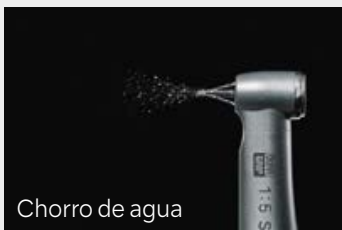
Chorro de agua