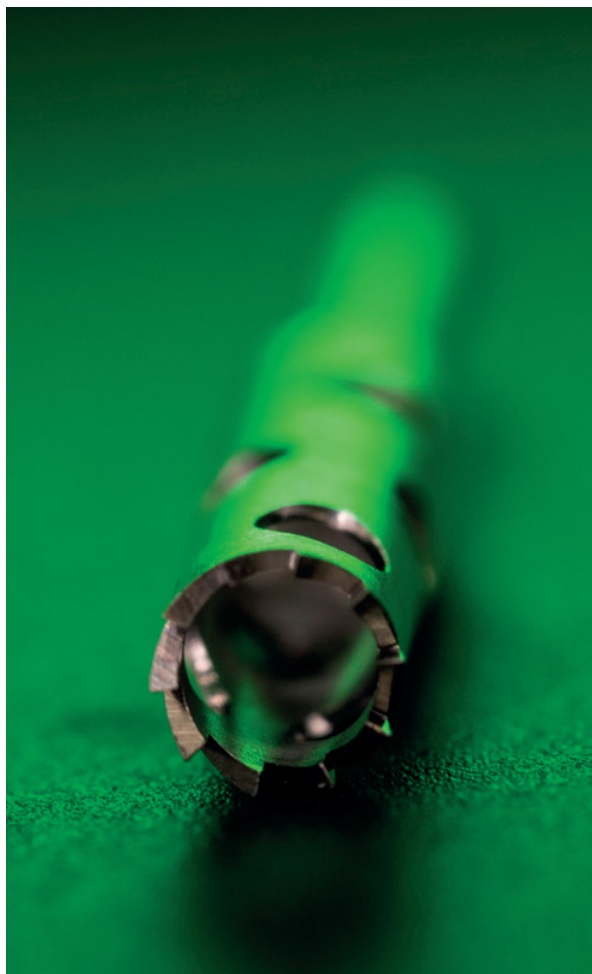
Osteógenos Media Library