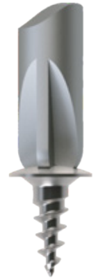
Detall punta AMB funció retentiva.