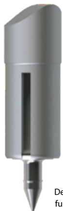
Detall punta amb funció retentiva.

Fabricada en acer inoxidable d'alta resistència per a ús mèdic d'excel·lents propietats mecàniques i alta resistència a la corrosió.