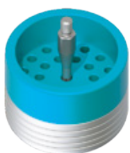
Detall activador interior de l'envàs.