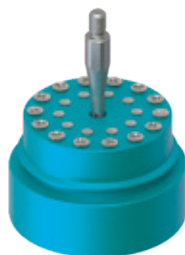
Detall activador posterior de l'envàs.