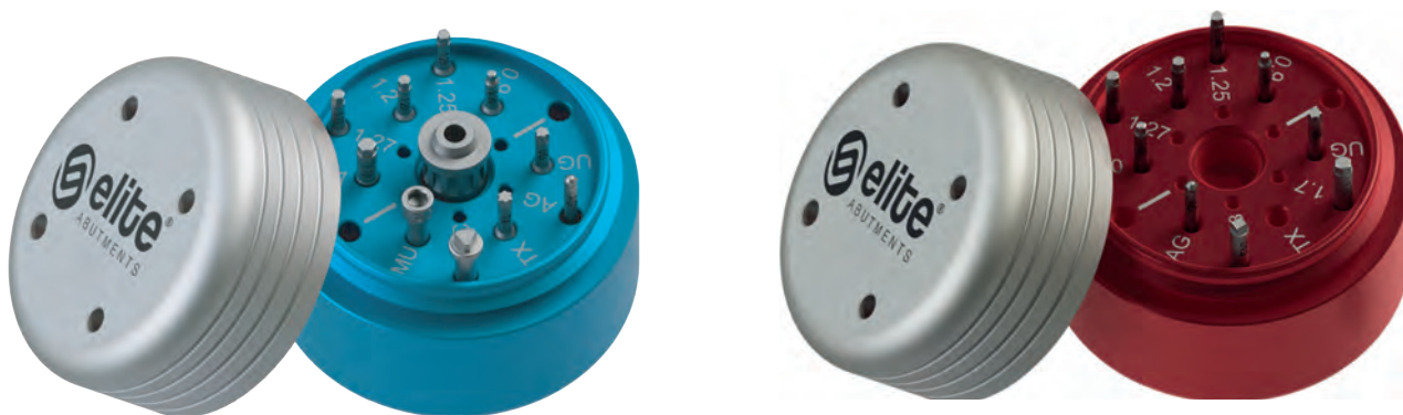
Detall color diferencial per a claus curtes (blau) i claus llargues (vermell).