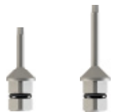
Curta VD127-1 Llarga VD127-2