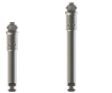
Curt INHEXDR1 Llarg INHEXDR2