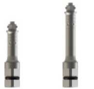
Curt INHEXDR3 Llarg INHEXDR4