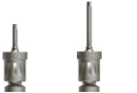
Curta VSD127-1-R Llarga VSD127-2-R