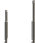
Curta VSD127-3 Llarga VSD127-4