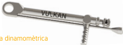
Carraca dinàmica VDIN2

VSK2-EXT-T Carraca Dinamomètrica VDIN Drivers connexió 4x4 Topalls Inclosos