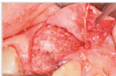
El defecte ossi està ple d'empelt heteròleg cobert amb una membrana de col·lagen (T-Barrier)