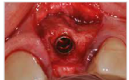
Implant inserit amb un evident defecte ossi horitzontal