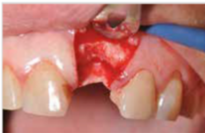
Obertura i despreniment de penjoll El defecte ossi vertical és evident. L'os és de el tipus D3-D4.

Ús de compactadores per evitar el dany de la paret òssia vestibular.