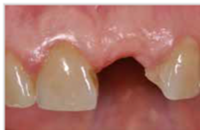
Teixits tous després de la curació completa.