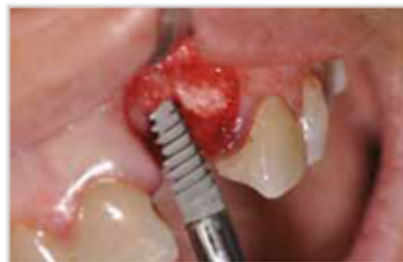
Preparació del llit de l'implant amb l'ús de compactadors per expansió i inserció d'un implant.